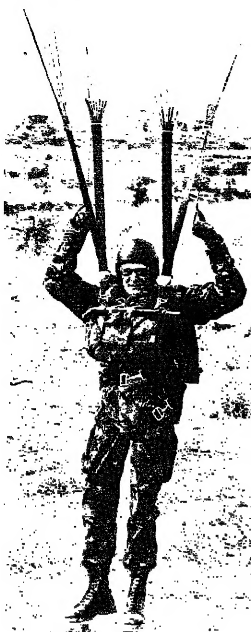
تحقيق مصور من وكالة «سيغما»